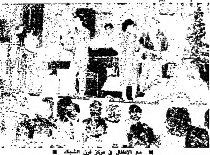
اطفال حضنة سن الليل يحملون الهدايا